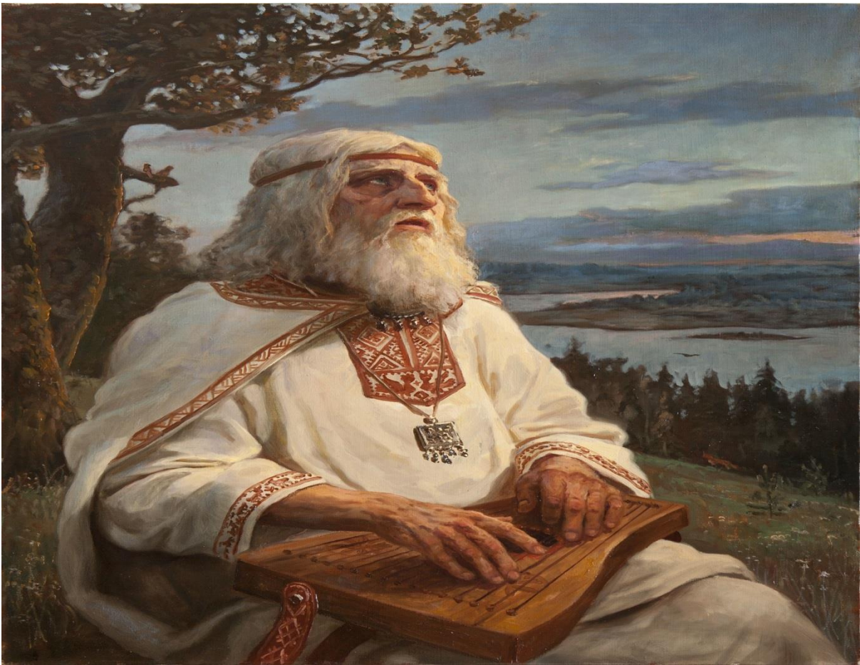
Приложение №2, и 3