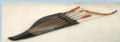
Лук и стрелы